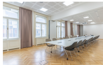
Office 2 – 293 sqm